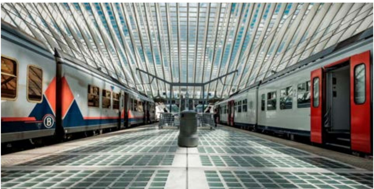
Het station van Luik-Guillemins is een van de modernste van België.

In een notendop komt het zowel op Belgische als Nederlandse treinstations op hetzelfde neer. Persoonlijk en privé mag je er foto's maken, zolang je niemand hindert. Zet je mensen op de foto, dan mag je ze niet zonder toestemming herkenbaar afbeelden als je de foto's wilt publiceren. Is je fotoshoot commercieel, wil je een film maken of leg je maar enigszins beslag op de ruimte, dan moet je sowieso toestemming