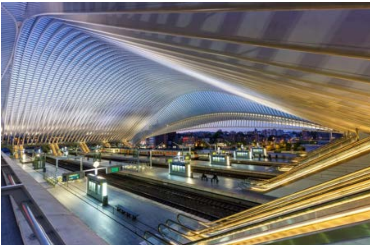
Bij avondlicht hebben stations een heel andere sfeer.

De NMBS organiseert op specifieke data zogeheten Photo Days in Antwerpen-Centraal, Bergen en Luik-Guillemins, waarbij amateurfotografen, fotostudenten en treineliefhebbers welkom zijn zonder toestemmingsdocument. De foto's zijn dan uitsluitend voor privégebruik bestemd en mogen niet commercieel worden gebruikt. Het dragen van een eigen geel veiligheidshesje is verplicht, een statief is niet toegestaan en fotograferen op de perrons zelf is verboden.