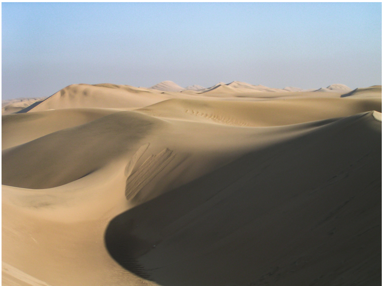
Woestijn in Peru

Minimalisme vraagt om rust en aandacht. Je hoeft niet constant nieuwe onderwerpen te zoeken. Blijf juist eens langer op één plek staan en kijk wat er gebeurt. Je zult merken dat je steeds beter leert zien welke beelden werken en welke niet. En juist door minder te fotograferen, ga je vaak betere foto's maken. Minimalistische fotografie is geen beperking, maar een manier om bewuster te kijken. Door te kiezen voor eenvoud geef je je onderwerp de ruimte om echt op te vallen. En dat maakt je beeld uiteindelijk sterker.